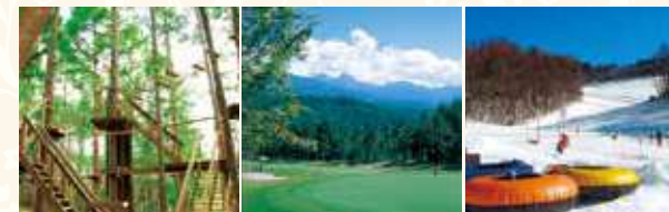
フォレストアドベンチャー蓼科 蓼科東急ゴルフコース 蓼科東急スキー場

客室数:90室 / 温泉大浴場(サウナ) / レストラン / カラオケルーム / ショップ ※東急リゾートタウン蓼科:蓼科東急ゴルフコース、蓼科東急スキー場、 フォレストアドベンチャー蓼科、グラマラスダイニング、トレッキングコース