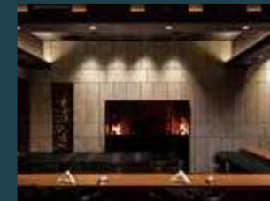
レストラン 昴(カウンター席)

レストラン「昴」はフレンチをベースとした薪火料理。薪や炭、藁といった自然エネルギーを採用し、その日仕入れた地元食材に合わせてメニューを考案いたします。オープンキッチンを囲むように設けられたカウンター席や、開放的なテーブル席から、自然を調理し食す、という演出をお楽しみください。