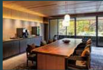
VIALA会員専用ラウンジ

エントランスを抜けると、鬼怒川渓谷の自然が広がります。吹き抜けて広々とした空間のロビーラウンジや、ファイヤーピットで火のゆらめきを見つめながら過ごすKINUGAWA TERRACE。お気に入りの場所で、皆様それぞれの過ごし方をお楽しみください。