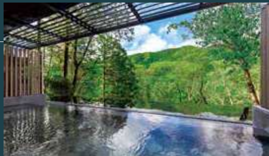
温泉大浴場(露天風呂)

自家源泉「釈迦の湯」を引き込んだ温泉大浴場。開放感を重視したつくりのサウナは、窓を設けることで明るい光を取り込み、リフレッシュできる空間にしつらえています。最上階には、星空を眺めながらプライベートな時間を満喫できる家族風呂もございます。