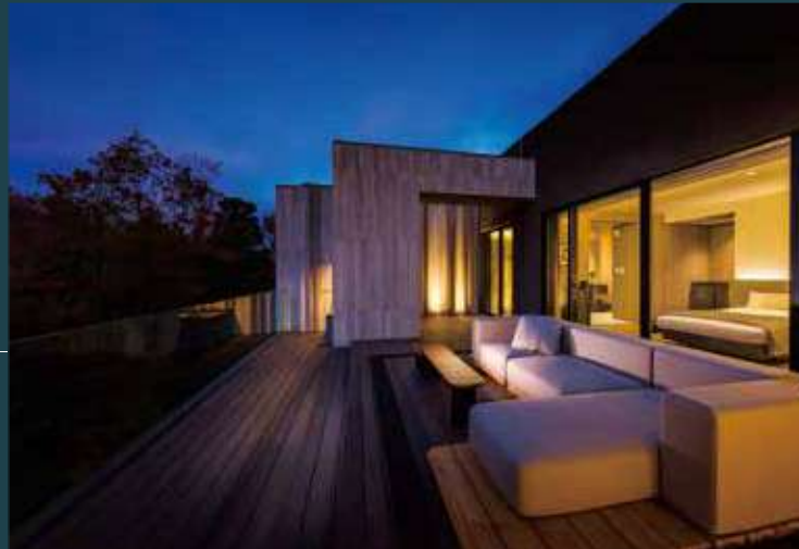
客室(シグネチャースイート)

全室温泉露天風呂付で、お部屋で過ごす時間がゆっくりと流れます。57㎡以上のデラックスから、152㎡のシグネチャースイートまで多彩なお部屋タイプをご用意しました。(ルームチャージ制)