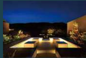
THE VIEW TERRACE