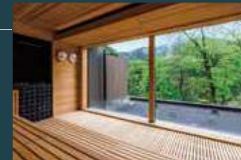
温泉大浴場(サウナ)