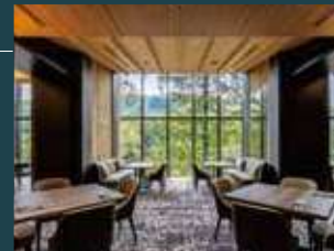
レストラン 昴(テーブル席)