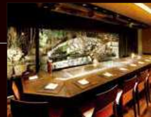
鉄板焼カウンター