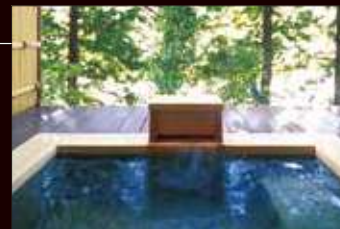
客室露天風呂 (VIALAデラックス・VIALAスイート) ※お部屋によって仕様異なります。