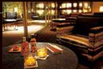
VIALA会員専用ラウンジ