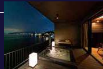
客室温泉露天風呂