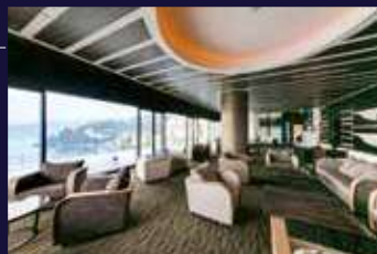
VIALA会員優先ラウンジ

クスノキに温かく迎えらるるエントランスを抜けると、落ち着いた落ち着いたロビーに、眺望テラスではゲストを包み込むように迎えてくれる海の眺めが広がります。